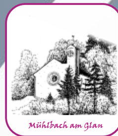
Mühlbach am Glan