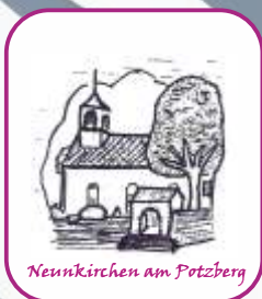
Neunkirchen am Pötzberg